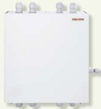
Module pour la climatisation ou le rafraîchissement