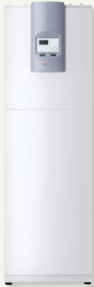
Pompe à chaleur