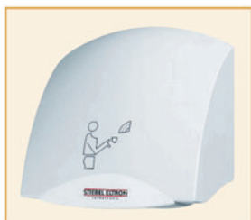
HTT 5 Turbotronic