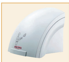
HTT 4 Turbotronic