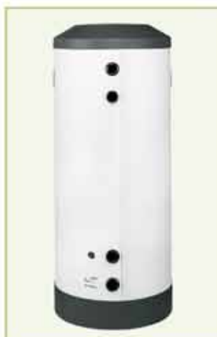
SBP 200 E