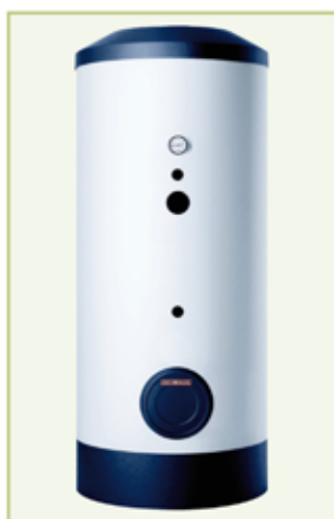
SBB 301 WP