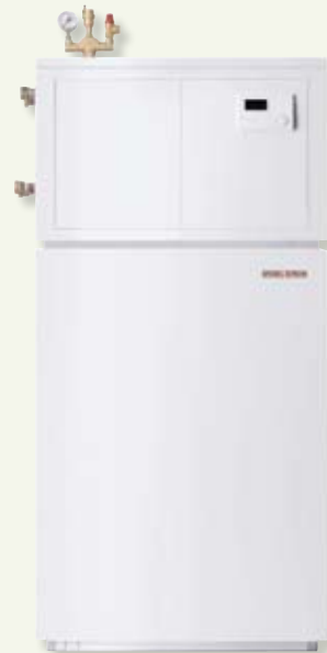
Version intérieure avec raccordement intégré