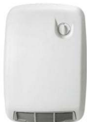
ZANKER SH 2002 AEG VH 211