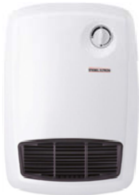
STIEBEL CBS 20 / CBS 20 S