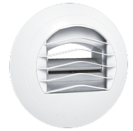
LWF AVM 125 -30