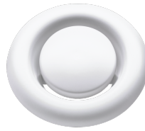
LWF AVM 125